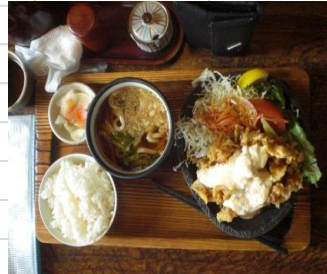
誕生日外食プレゼント